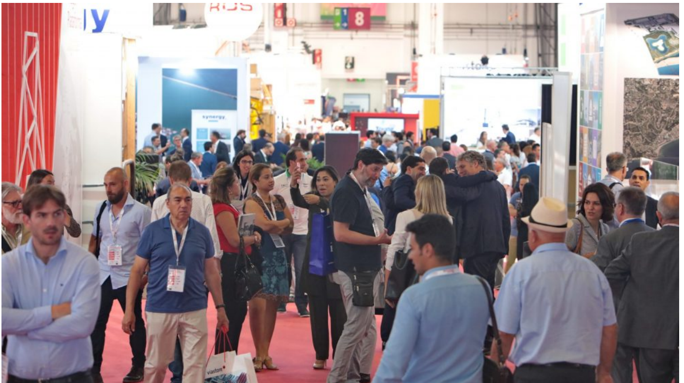
Imagen de archivo de la última edición del Salón Internacional de la Logística de Barcelona

El Gobierno extremeño explicará su estrategia logística e intermodal en Barcelona entre el 31 de mayo y el 2 de junio