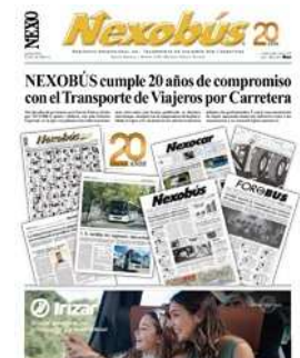
Edición Especial 20 Años

Acceso a Hemeroteca Digital Suscripción a la Edición paper