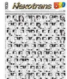
Edición Especial nº 500

Acceso a Hemeroteca Digital Suscripción a la Edición paper