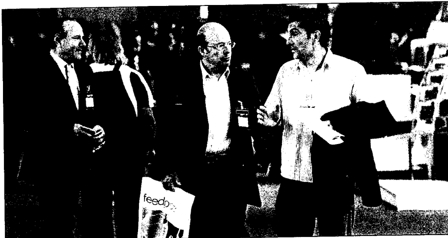
La próxima edición del Salón Internacional de la Logística de Barcelona (SIL) tendrá lugar del 5 al 7 de junio del 2012

Al mismo tiempo, después de la buena acogida obtenida en las dos últimas ediciones con el área SIL Tech, el SIL 2012 potenciará aún más el sector de las nuevas tecnologías con la creación de una gran área tecnológica. Dentro de esta área tecnológica tendrán lugar diferentes paneles tecnológicos sectoriales que contarán con la participación de ponentes de gran prestigio nacional e internacional. El auge y la importancia del sector tecnológico en la logística es lo que ha propiciado esta apuesta decidida por este sector por parte de la organización del Salón Internacional de la Logística y de la Manutención.