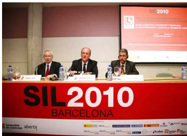
El SIL acoge el mayor programa de conferencias del sector con la celebración del SIL Logistics Directors Symposium y el 9º Forum Mediterráneo de Logística y Transporte.

Además del SIL Logistics Directors Symposium el SIL 2011 también es el escenario del 9º Forum Mediterráneo de Logística y Transporte, la 12º Jornada de Zonas y Depósitos Francos, la 2ª Jornada ACTE y la 2ª Jornada BCL.