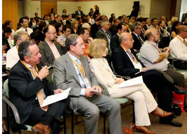
La 9ª edición del Forum Mediterráneo de la Logística y el Transporte aborda las perspectivas para el sector del transporte y la logística en el Mediterráneo.

Dentro del 9º Fórum Mediterráneo de la Logística y el Transporte también tienen lugar una serie de encuentros empresariales que ponen en contacto a diferentes empresas para fomentar los contactos y los negocios.