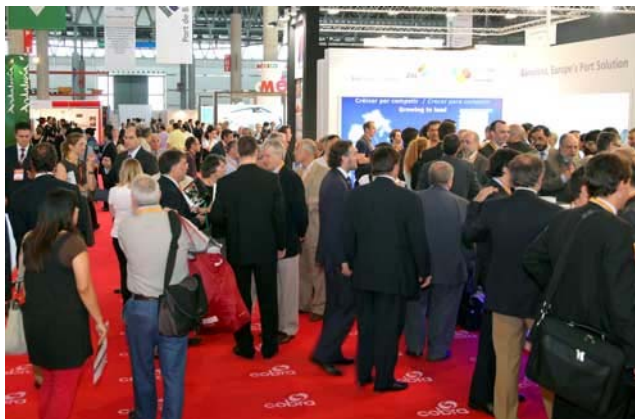
Grandes operadores logísticos a nivel mundial han confirmado su presencia en el SIL 2011.

Nuevamente, todos los sectores que forman parte del sector de la logística y de la manutención están representados en el SIL 2011. Al margen de la destacada participación de los principales operadores logísticos, los diferentes modos de transporte existentes están presentes. En este sentido, el SIL 2011 cuenta con una nutrida representación de empresas del sector ferroviario —como pueden ser Renfe, Lorry-Rail Las Autopistas Ferroviarias o ADIF—, del sector aéreo —encabezadas por Aena / Clase— y del sector portuario —Apport, Noatum, Sistema Portuario y Logístico de Andalucía, Autoridad Portuaria de Valencia, Nantes Saint-Nazaire Port Authority, Port de Barcelona o Puertos del Estado, entre otras—.