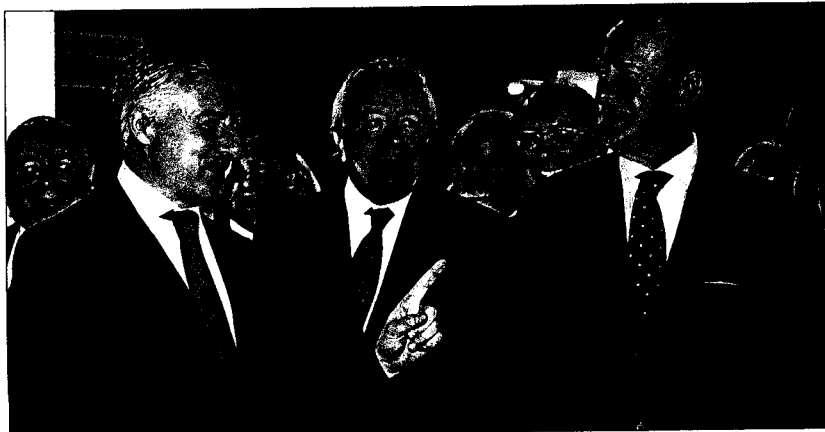
La inauguración del SIL estuvo presidida por el ministro de Fomento, José Blanco, entre otras personalidades.

El Salón Internacional de la Logística y de la Manutención celebrará su próxima edición del 5 al 8 de junio de 2012