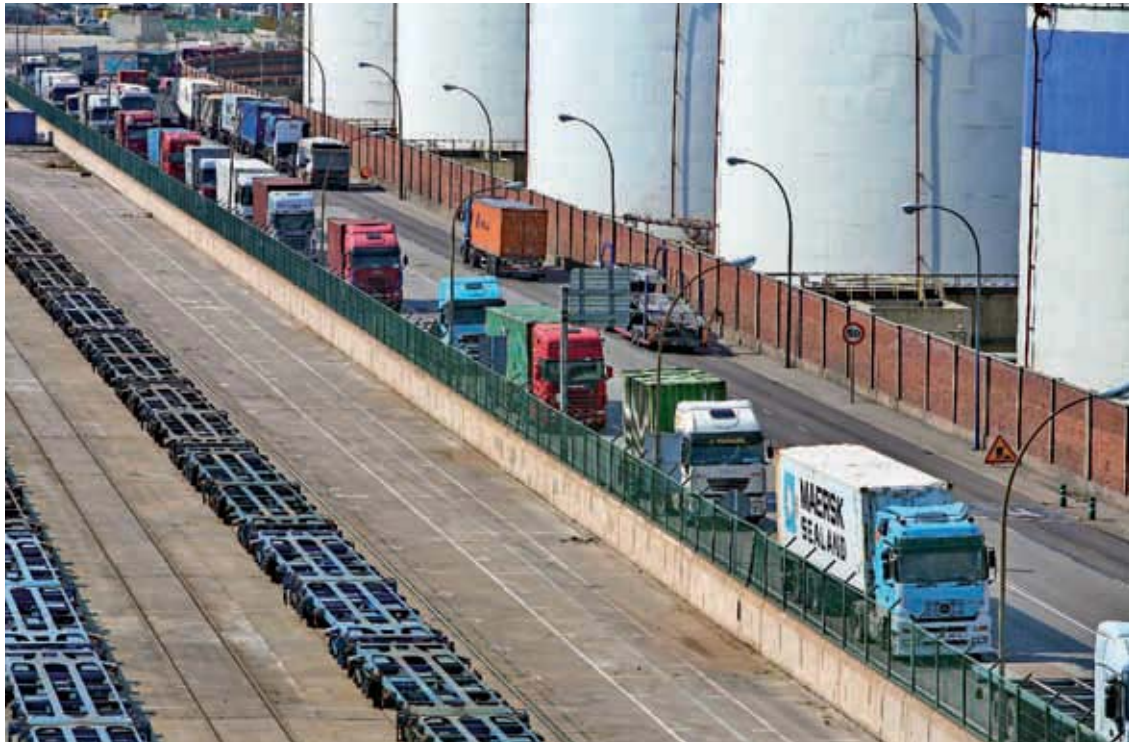
La distribución es la segunda actividad más externalizada por las empresas españolas

No obstante, este año se observa un descenso de la subcontratación de los servicios del transporte respecto