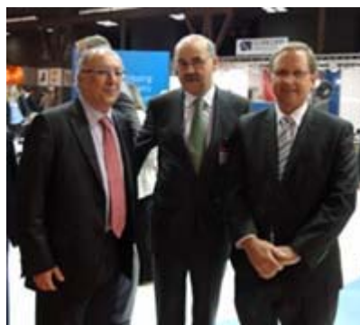
El presidente de OPPE con directivos de NOATUM