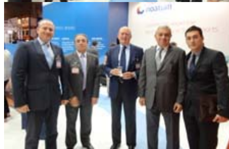
El stand de NOATUM en la pasada edición del SIL fue uno de los más visitados