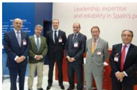
Empresarios del sector en el stand de NOATUM