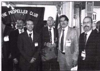
Dos instantáneas de varios socios del Propeller Club de Barcelona