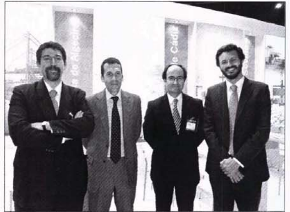
Miembros de la comunidad portuaria de Bahía de Algeciras