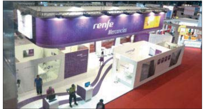
Stand de Renfe Mercancías

El director general de Abertis Logística señaló que en los primeros meses del 2011 se han cerrado diversas operaciones comerciales, que han supuesto el alquiler de más de 45.000 metros cuadrados de superficie en el conjunto de la red de parques que gestiona la compañía en el ámbito internacional. De esta forma, los niveles de ocupación han experimentado un crecimiento situándose actualmente en el 77%, frente al 66% de diciembre del 2010.