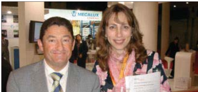
Equipo directivo y responsables de la red de parques logísticos de Abertis Logística