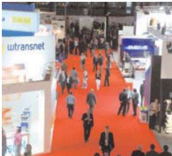
Es hoy el día de recoger y marchar: se cierra la edición 2011 del SIL.

El SIL afronta hoy su última jornada, un día que acaba por confirmar que probablemente estamos ante un certamen que, dada la coyuntura, se antoja demasiado largo