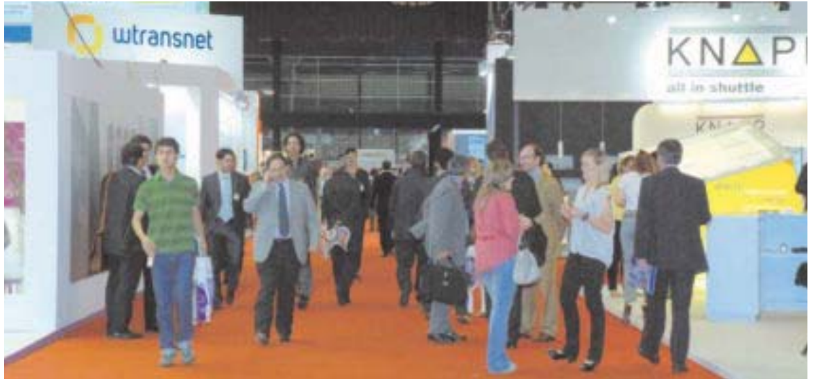
Después de dos jornadas de transición, ayer el SIL recuperó el pulso y vivió una más que intensa jornada ferial.

Y no fue lo único. También el Propeller Club de Barcelona propició un momento de encuentro en el SIL con representantes de los clubs de toda España, y las jornadas técnicas poblaron las salas de profesionales ávidos de intercambiar experiencias logísticas.