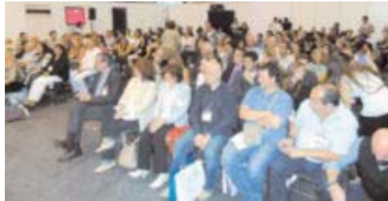
Alumnos de un total de ocho centros recogieron sus diplomas.

Con ellos y con los de promociones anteriores, el número total llega a los 548 diplomados