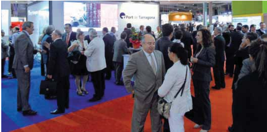
El Puerto de Tarragona y Apportt, con su convocatoria de ayer en el SIL, consiguieron acaparar el interés de los participantes en el certamen.

Si hay algo que no puede negarse de un certamen como el Salón Internacional de la Logística es su capacidad para ejercer de termómetro de la temperatura del sector. Sin en las dos ediciones anteriores la crisis ya se dejó notar entre los pasillos del salón, este año no ha sido menos. Pese a todo, el SIL mantiene viva la llama de un sector que quiere moverse y encontrar el final del túnel mas pronto que tarde.