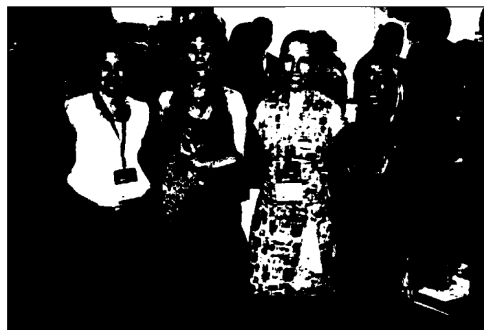
Equipo de la Plataforma Logística Aquitaine-Euskadi (PLAE)