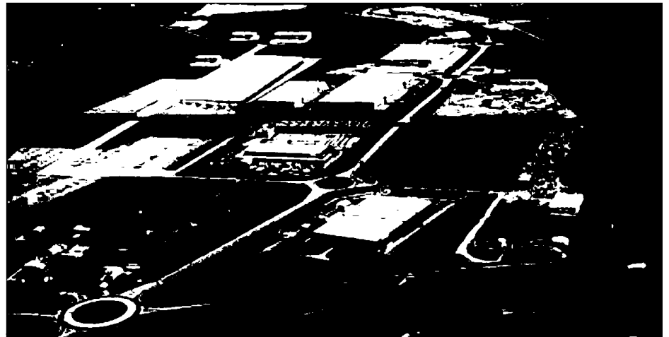
La Zona de Actividades Logísticas (ZAL) de Toulouse está situada en el complejo Eurocentre

Finalmente, la puesta en marcha en febrero del 2009 del servicio ferroviario BarcelLyon Express, que conecta las dos terminales de contenedores del puerto de Barcelona (TCB y TERCAT) con la terminal ferroviaria de Naviland Cargo en Verissieux, en Lyon, ubicada en el centro del principal nodo logístico francés, es una apuesta más para incrementar los servicios del puerto en Francia.