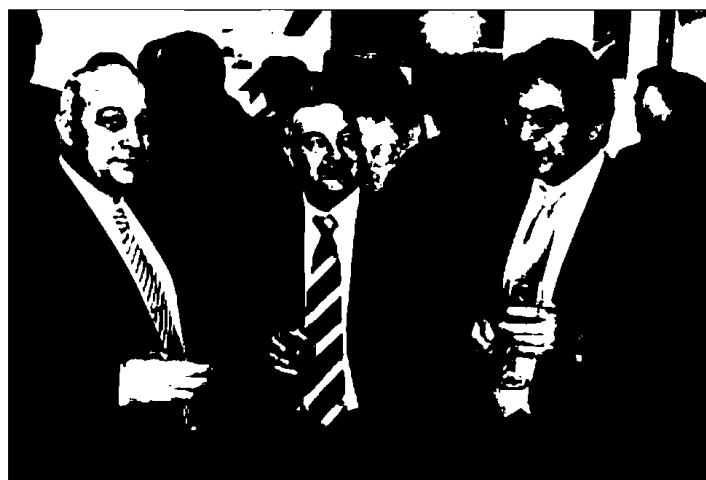
Representantes de la Autoridad Portuaria de Pasajes