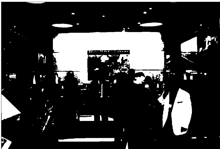
Transfennica presentó sus servicios