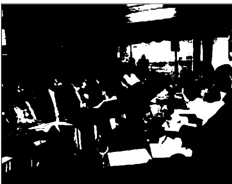
La jornada fue organizada por el CEL

Si los pasillos del SIL han vivido momentos de gran abarrotamiento de profesionales, las jornadas técnicas no han sido menos. Otra de las sesiones que presentó una sala llena fue la dedicada a «Las claves del éxito de un tender», organizada el miércoles por el Centro Español de Logística (CEL) y el SIL. En esta sesión, diferentes agentes del sector apuntaron las claves a tener en cuenta a la hora de negociar un contrato logístico, conocido en el sector como tender.