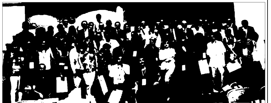
Alumnos que recibieron el diploma

De nuevo el Salón Internacional de la Logística y de la Manutención (SIL) de