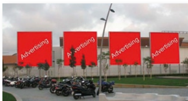
Tanques publicitàries (4 unitats): 24.000 EUR

SIL2012 BARCELONA Per a més informació, preguem contacti l'organització: marketingsil@el-consorci.com