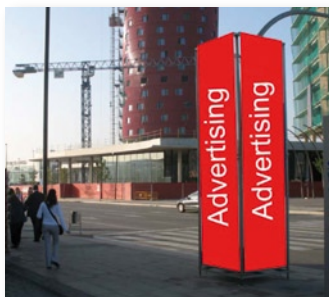
Torre quadrangular: 2.000 EUR