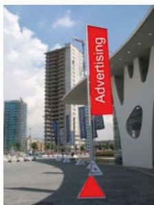
Pal: 1.500 EUR

Oportunitat única per ser el primer a impactar en el visitant.